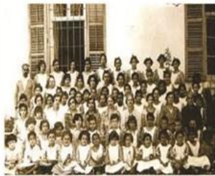
مدرسة تبشيرية الناصرية ١٩٢٦

جمعية الاليناس اليهودية في باريس استت سنة ١٨٥٦ اول مدارسها في بغداد وتعد هذه المدرسة من اهم تلك المدارس حيث استمرت وتطورت وفتحت فروعها لها في البصرة ١٩٠٣ وفي الموصل سنة ١٩٠٧ وفي الحلة سنة ١٩٠٧ ايضا وفي العمارة سنة ١٩١٠ وفي خاتمين سنة ١٩١٣