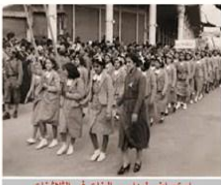
استعراض لمدارس البنات في الثلاثينات

في سنة ١٩٢٠ افتتحت خمس مدارس حكومية للبنات اثنتان في بغداد وواحدة في كل من الموصل وكربلاء والديوانية وكانت تدير تلك المدارس المدرسات الانكليزيات واعيدت بعض المعلمات اللواتي كن يشغلن في التعليم في العهد العثماني