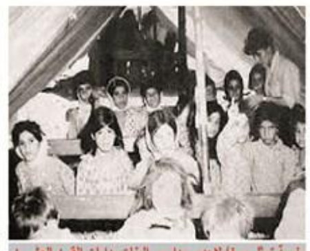
خيمة تمثل صفحا لحدى مدارس البنات بدايات القرن العشرين

في سنة ١٩٢٠ افتتحت خمس مدارس حكومية للبنات اثنتان في بغداد وواحدة في كل من الموصل وكربلاء والديوانية وكانت تدير تلك المدارس المدرسات الانكليزيات واعيدت بعض المعلمات اللواتي كن يشغلن في التعليم في العهد العثماني