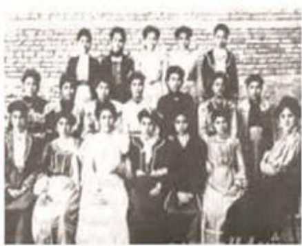
مدرسة الاليناس بالبصرة

جمعية الاليناس اليهودية في باريس استت سنة ١٨٥٦ اول مدارسها في بغداد وتعد هذه المدرسة من اهم تلك المدارس حيث استمرت وتطورت وفتحت فروعها لها في البصرة ١٩٠٣ وفي الموصل سنة ١٩٠٧ وفي الحلة سنة ١٩٠٧ ايضا وفي العمارة سنة ١٩١٠ وفي خاتمين سنة ١٩١٣